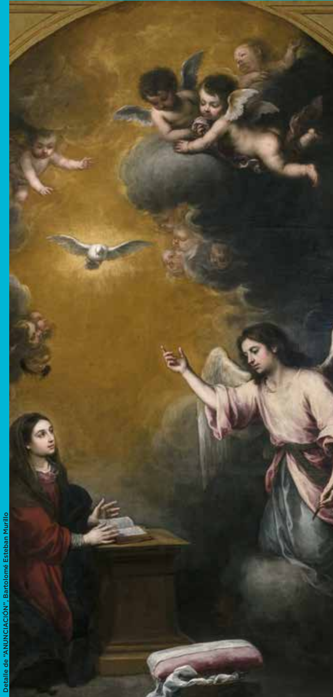
Detalle de "ANUNCIACIÓN", Bartolomé Esteban Murillo

De martes a domingos: de 10:00 h a 12:00 h.